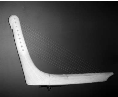
Рис. 2. Арфа-торын (экспонат музея «Природа и человек» г. Ханты-Мансийск)